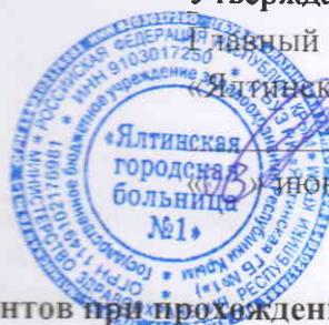
Схема маршрутизации пациентов при прохождении профилактического медицинского осмотра